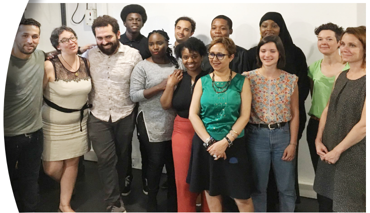
Coopérative Jeunes Majeurs Est Val d'Oise, Juin 2019

Les Coopératives d'Activités et d'Emploi (CAE) réunissent des professionnels autonomes, et permettent aux créateurs qui les rejoignent de travailler à leur propre rythme. Ils bénéficient d'une protection sociale, d'un appui individuel et collectif (sous forme d'ateliers et de formations). Lorsqu'ils dégagent du chiffre d'affaires, les professionnels autonomes deviennent entrepreneurs-salariés en CDI. Certaines CAE sont implantées spécifiquement pour les entrepreneurs de QPV à l'image de Port Parallèle dans la seconde couronne nord de la région parisienne.